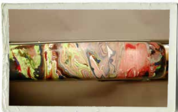
Man kan styra mönstret genom att röra om färgerna på ytan, men du kan aldrig få till två likadana gitarrer!