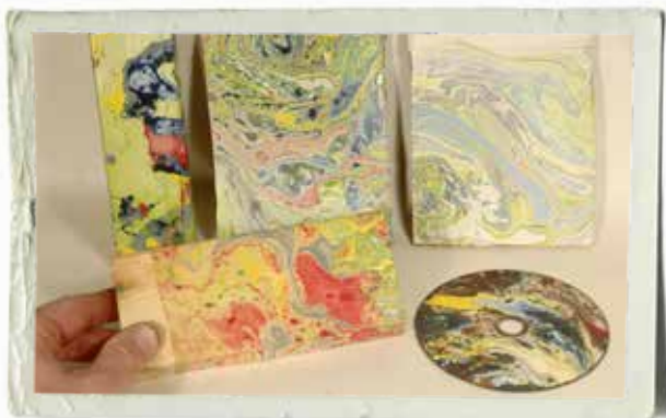
Testa först! Kör några vändor med provbitar så du får en känsla för hur färgbudet betar sig.