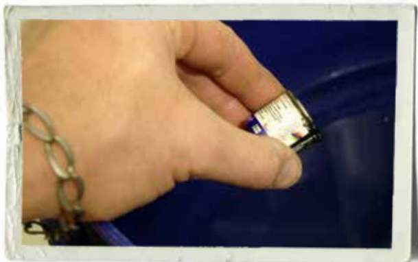
Håll färgen försiktigt i vattnet och från låg höjd. Börja med de mörka kulörerna och låt varje kulör få tid på sig att flyta ut ordentligt.