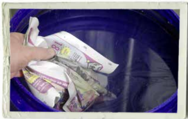
Innan man drar upp gitarren måste färgen på ytan bort. Ta ett hopskrynklat tidningspapper och sug upp färgen. På bilden är gitarren redan uppe.