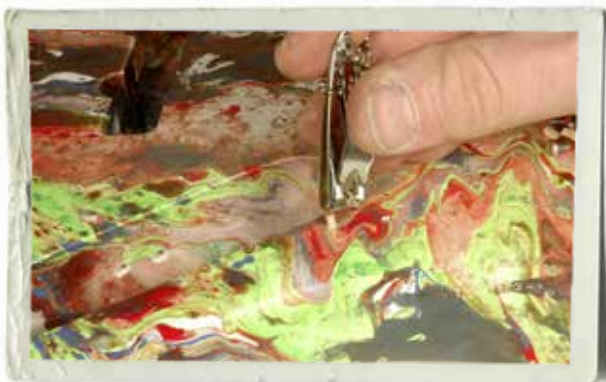
När färgen torkat något drar man upp tändstickorna ur alla skruvhål.