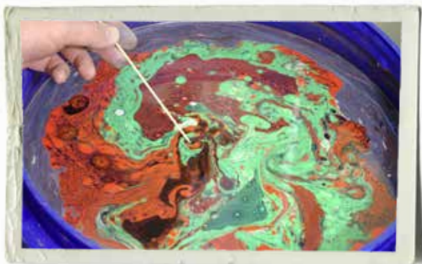
När du är nöjd med färgkompositionen tar du en tunn pinne och drar försiktigt genom alla färgerna tills då får det mönster du vill ha.