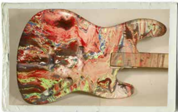
Uppre ur doppet. Låt fantasin flöda: till vänster ser vi en del av världsrymden och till höger ett flygfoto av Östersjön.