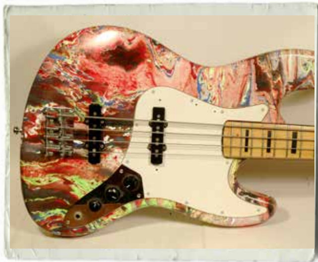
Slutresultatet! Den här skulle ha platsat på Woodstock 1969!

I förra numret förberedde vi vår basgitarr för färgbad. Nu är det dags att doppa.