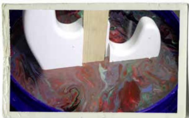
Point of no return! Här åker vår basgitarr ner genom färghinnan. Tänk på att färgen på vattenytan ska räcka till hela gitarren. Snåla inte.